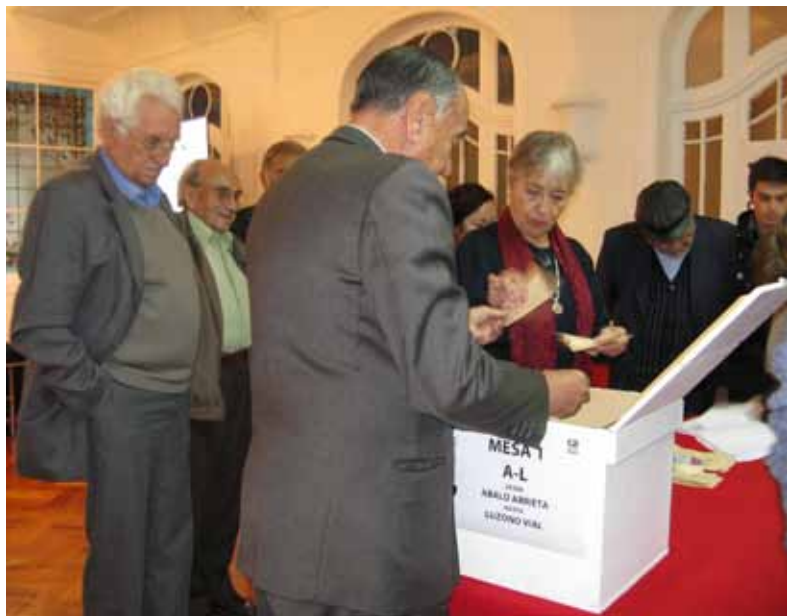
☰ Apertura de urnas, Elecciones CA 2011